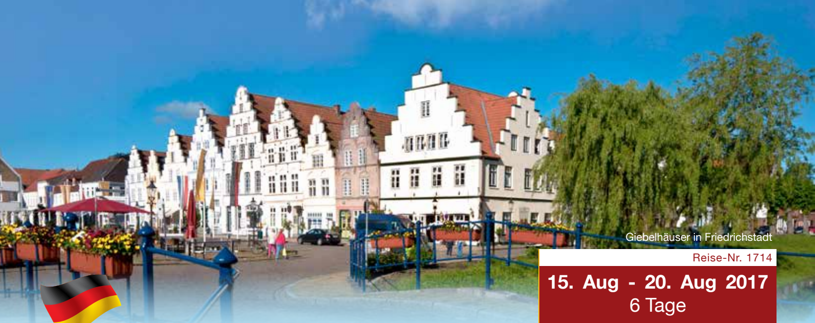
Giebelhäuser in Friedrichstadt