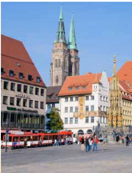
Minibahn in Nürnberg

Reise-Nr. 1723 26. Nov - 29. Nov 2017 4 Tage