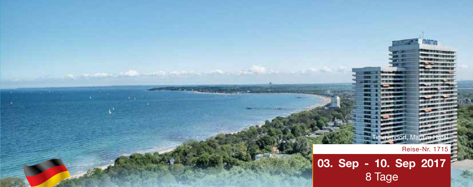
Timmendorf, Maritim Hotel