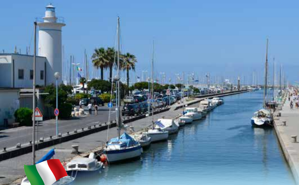
Hafen an der Versiliaküste