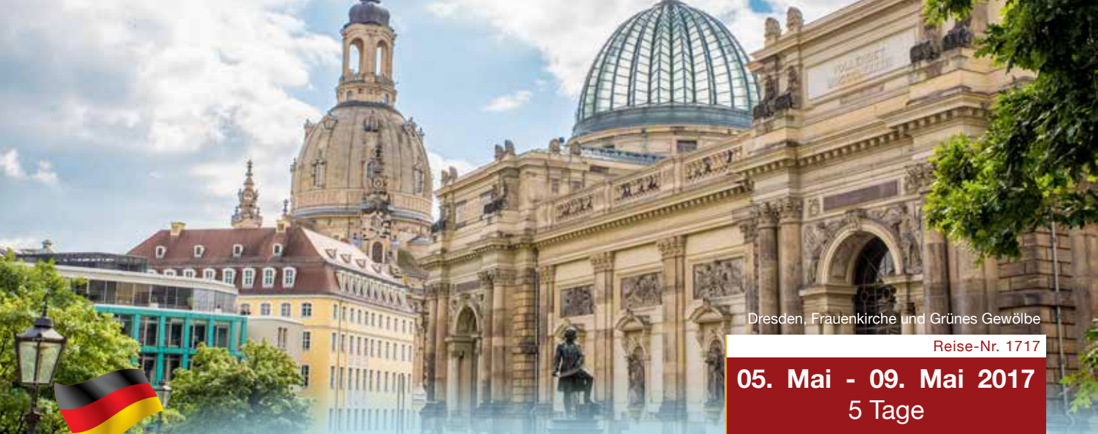
Dresden, Frauenkirche und Grünes Gewölbe