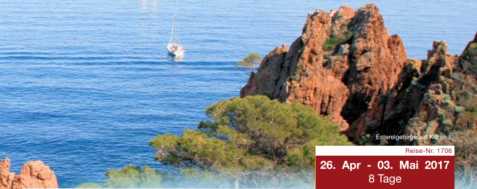
Esterelgebirge auf Korsika