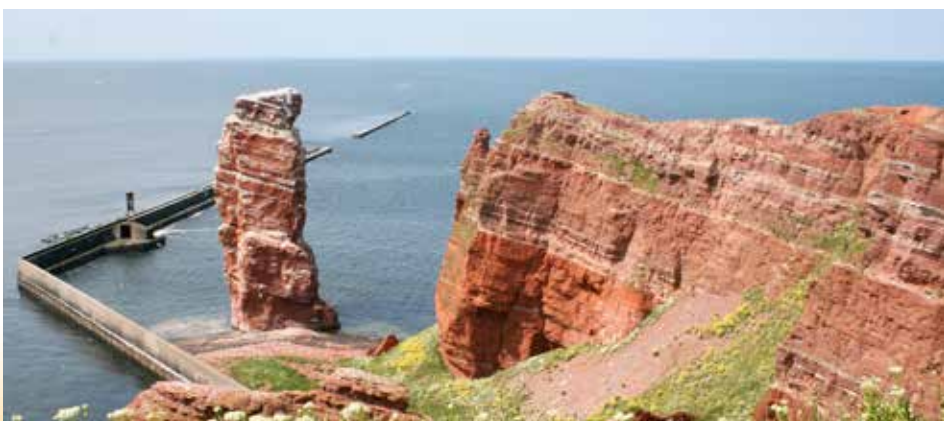
Helgoland, Nathum Stak (Lange Anna)

Reise-Nr. 1714 15. Aug - 20. Aug 2017 6 Tage