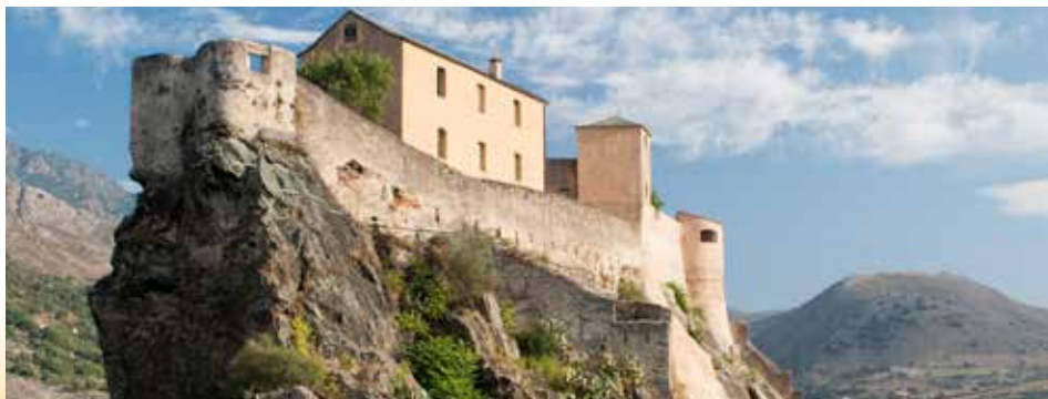
Burg von Corte