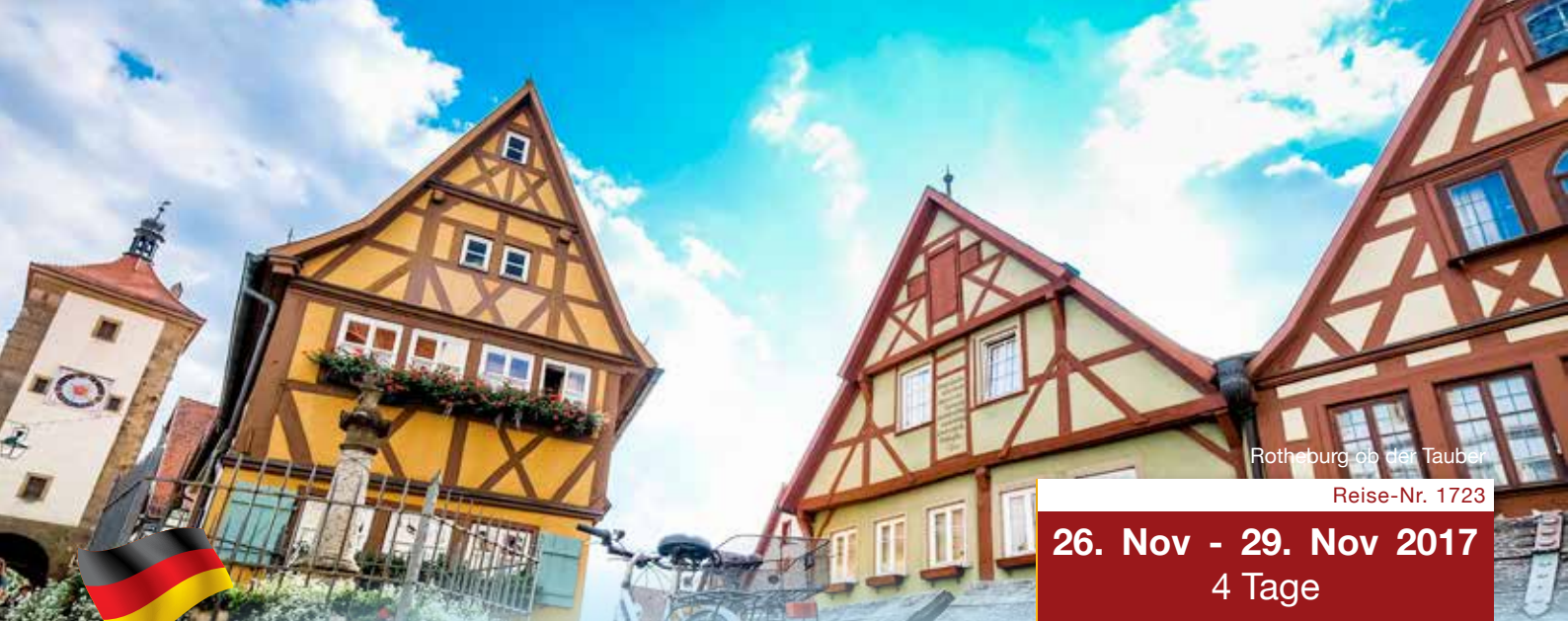
Rothenburg ob der Tauber