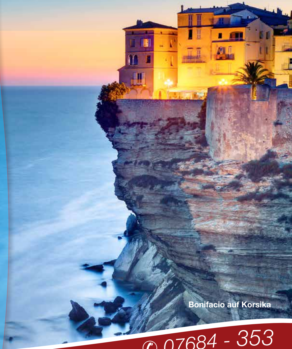
Bonifacio auf Korsika