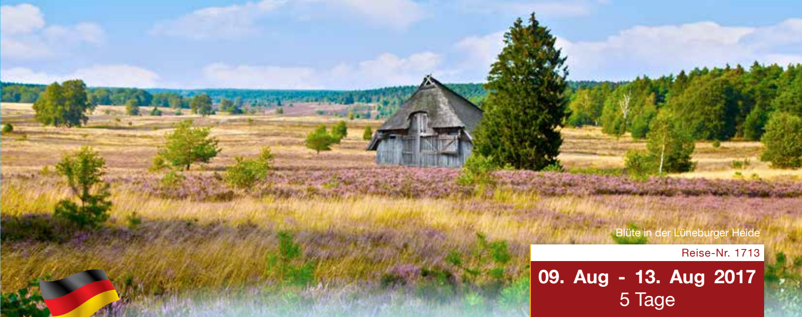
Blüte in der Lüneburger Heide